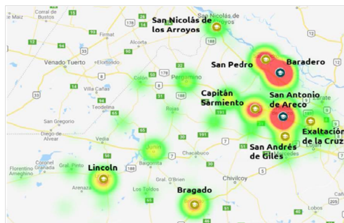
Mapa 2. Procedencia estudiantil

La UNSaDA ha logrado instalarse en el territorio; en relación con esto, y respecto de las posibilidades de las personas para acceder a la educación superior, es importante señalar que la región de influencia de la Universidad supera un radio de aproximadamente 60 km, en torno a sus sedes académicas de San Antonio de Areco y de Baradero, tal como puede observarse en el mapa.